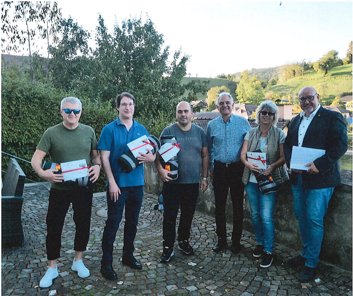
Die Preisträger des Energiespar-Wettbewerbs