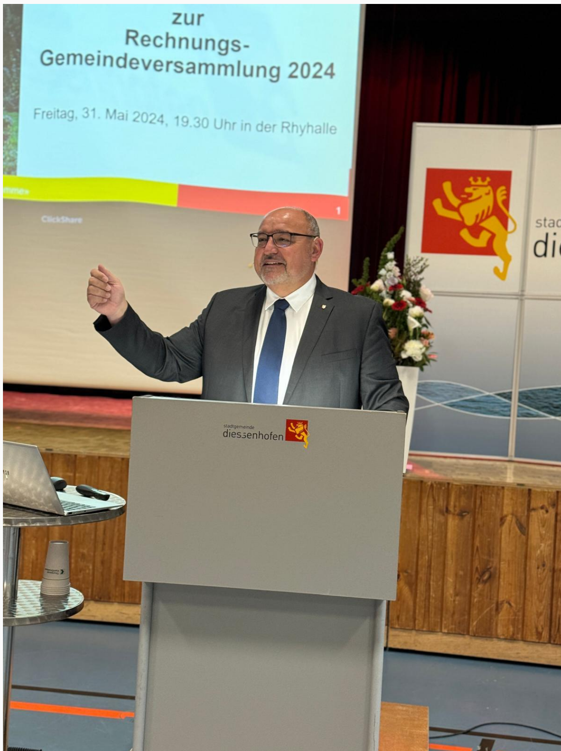
Stadtpräsident Markus Birk führt durch die Gemeindeversammlung

Fast einstimmig genehmigte die Gemeindeversammlung zudem die Jahresrechnung 2023, welche mit einem Ertrag von CHF 18'097'448 und einem Aufwand von CHF 18'393'771 mit einem Aufwandüberschuss von CHF 296'323 abschloss.