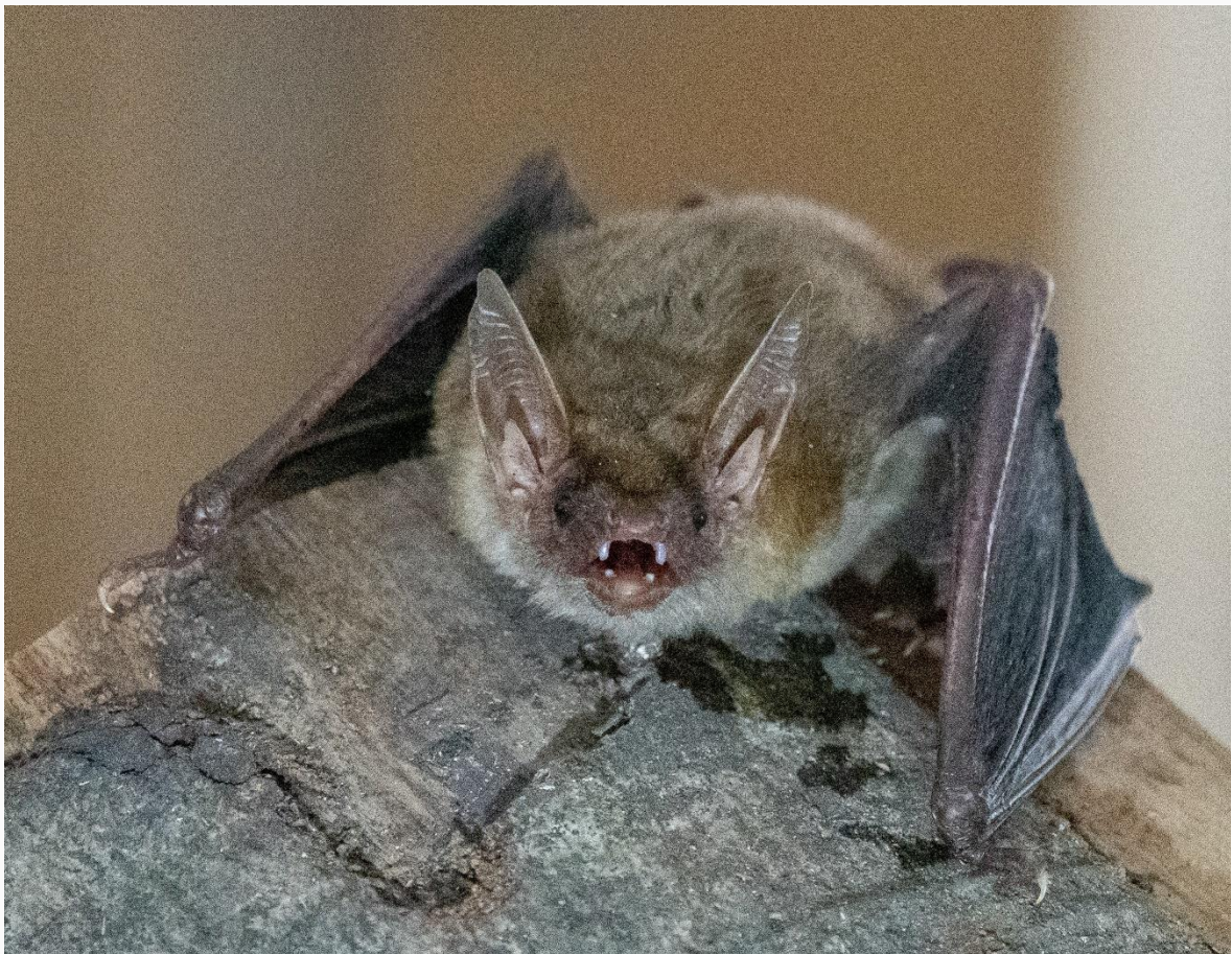
Das Grosse Mausohr ist eine der zahlreichen heimischen Fledermausarten.