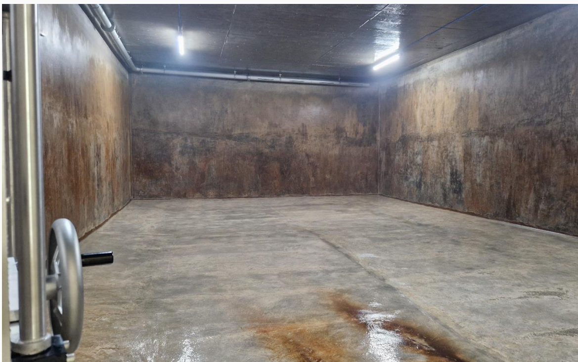
Die blitzblank gereinigte und desinfizierte Wasserkammer im Reservoir Buchberg 2

Im Rahmen der periodischen Kontroll- und Reinigungsarbeiten wurden Anfang Juli sämtliche Kammern der Reservoir Buchberg I und II sowie Rodenberg vollständig ausgespült und desinfiziert. Aufgrund der hervorragenden Wasserqualität kann der Reinigungsintervall auf ca. alle drei Jahre festgelegt werden. Dieser Moment bietet jeweils die einmalige Möglichkeit, einen Blick auf die leere Kammern durch die Drucktüren zu bestaunen.