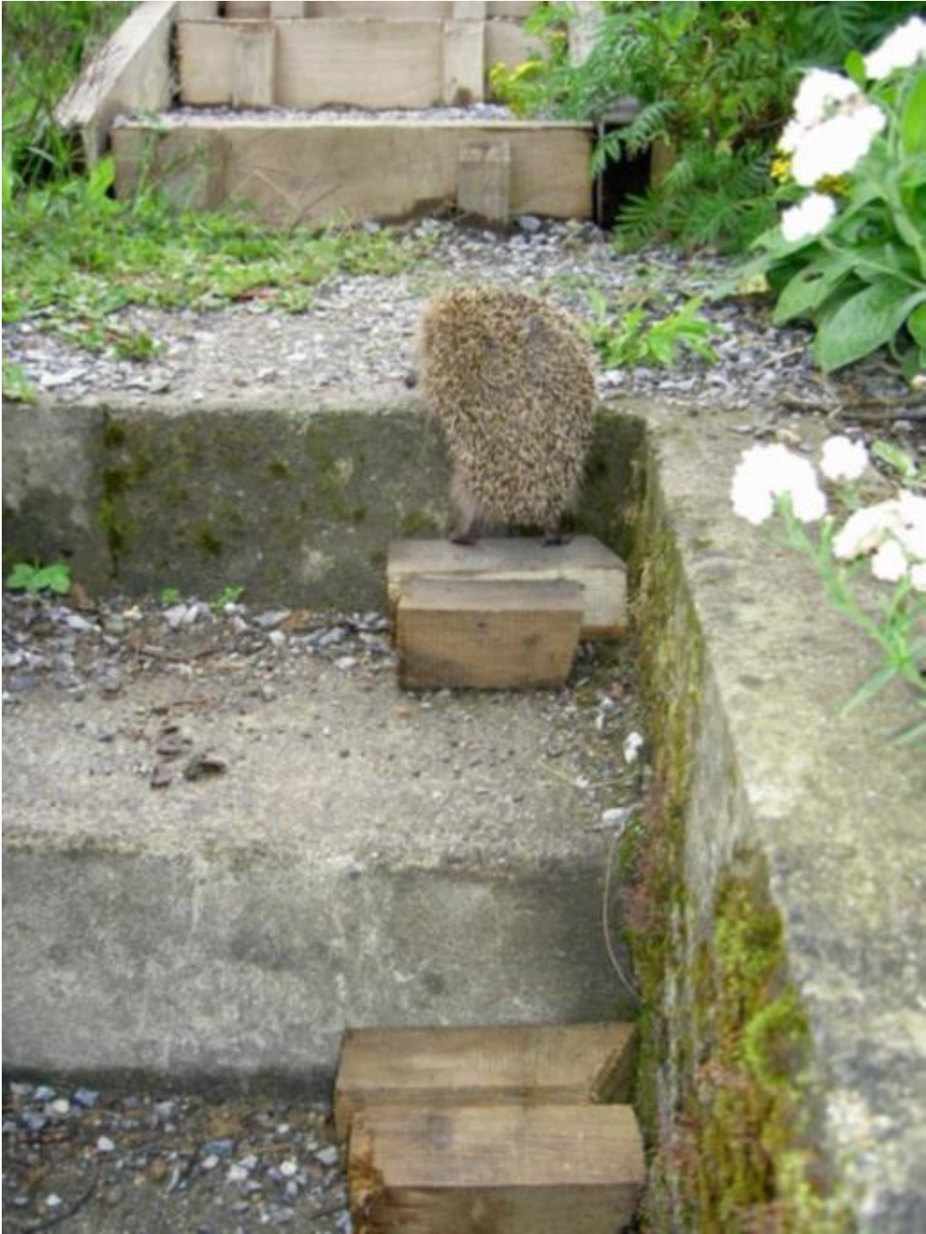
Mit einfachen Massnahmen wie solchen Zwischenstufen werden dem Igel Lebensräume zugänglich gemacht