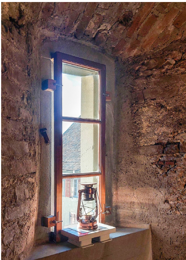
Fensterische mit Backsteinbogen

spuren), Rekonstruktion der Mondkugel und Koppelung mit dem Zeigertrieb, Rückversetzung der südlichen Schopfanbauten, neues Riegelwerk und neuer Dachstuhl für den nördlichen Anbau. Seit 1944 unter Bundesschutz. 1972 Verlegung des Bürgergemeindearchivs in das Rathaus.