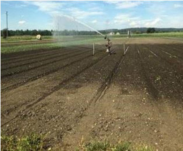
Bewässerung während einer Trockenheitsperiode

Eine nachhaltige Entspannung der Situation ist erst durch eine intensive Regenphase von mindestens zwei Tagen zu erwarten.