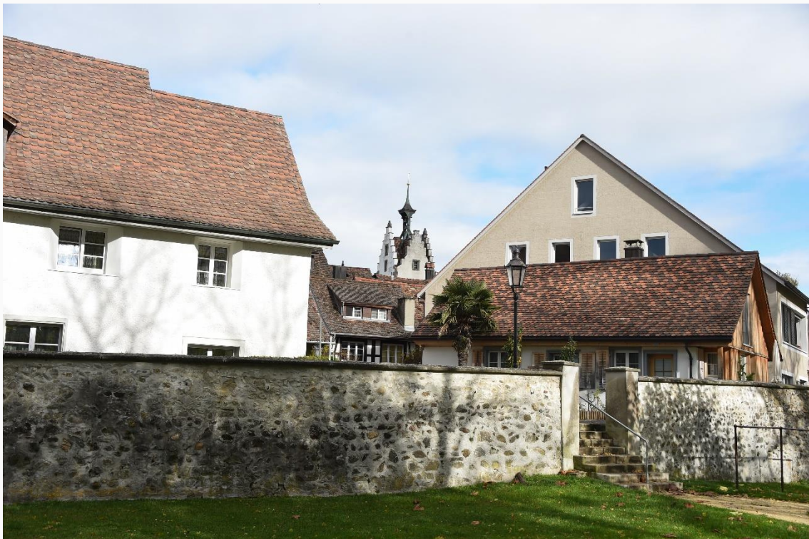
Die Denkmalpflege Thurgau befindet sich im Umbruch.

Wichtig: Ist ein Objekt im IDEGO enthalten, dann ist es noch nicht automatisch unter Schutz gestellt. Es gilt eine sogenannte Schutzvermutung. Eine Überprüfung dieses Status erfolgt auf Verlangen der Eigentümerschaft oder Behörden, sobald Renovationen, eingreifende bauliche Veränderungen oder ein Verkauf der Liegenschaft anstehen. Erst bei einer Bestätigung der Schutzvermutung wird der Schutz mittels einer Einzelunterschutzstellung verbindlich.