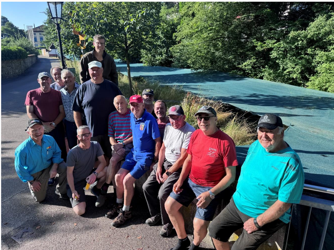
Mitglieder der Fischerzunft vor dem "Netzdach" am Geisslibach

Die Stadtgemeinde Diessenhofen bedankt sich herzlich bei der Fischerzunft für ihr wiederholtes Engagement zum Schutz unserer Gewässer und deren Bewohner. Solche lokalen Initiativen zeigen eindrucksvoll, wie viel mit einfachen Mitteln erreicht werden kann – vorausgesetzt, wir alle tragen unseren Teil dazu bei.