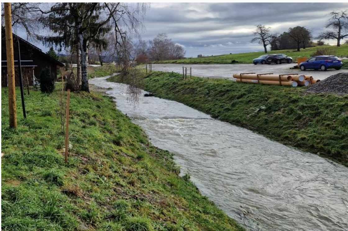
Der Geisslibach nach der Revitalisierung in Willisdorf

Das Amt für Umwelt soll die Beurteilung dieses Weiterströmungsbereichs - gegebenenfalls unter Beizug einer hydrologischen Fachstelle - vornehmen bzw. koordinieren.