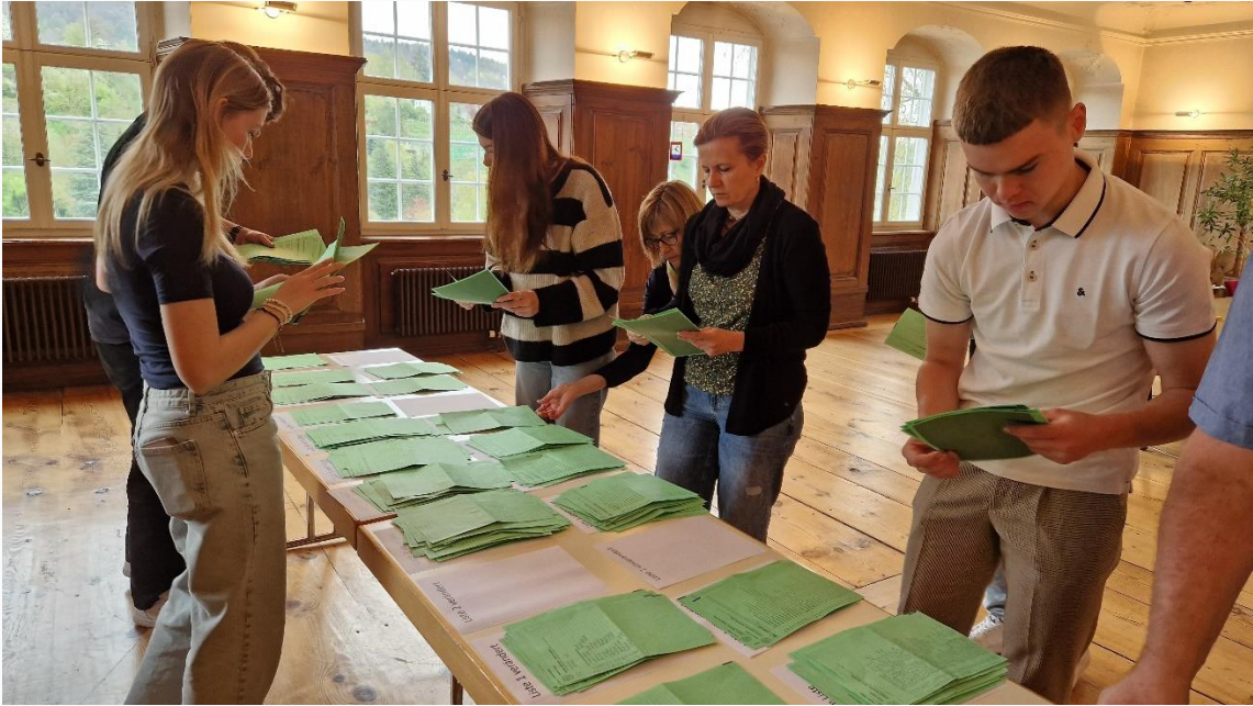
Das Wahlbüro am Super-Wahlsonntag vom 7. April 2024