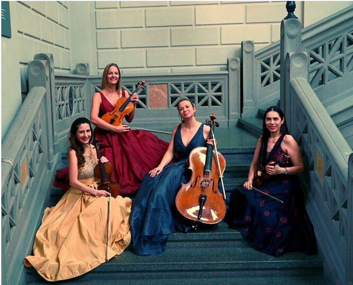
Das Quartett möchte die Musik mit dem Publikum teilen

Da die Platzzahl limitiert ist, bitten wir dringend um Anmeldung. So können Sie sich einen Platz im Rathaussaal sichern. Ihre Anmeldungen werden telefonisch unter 052 657 31 33 oder kuhn@meistergeigen.ch entgegengenommen.